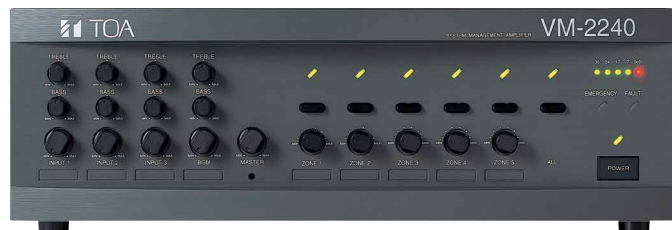
Mặt trước của VM-2120 (120W) / VM-2240 (240W)