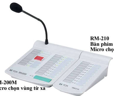
RM-200M Micro chọn vùng từ xa

Nội dung thông báo có thể là được đọc trực tiếp hoặc thông qua kích hoạt các bản tin thông báo ghi âm sẵn. Micro chọn vùng từ xa có thể kết nối với bộ RM-210 để mở rộng phím chức năng khi cần thiết.