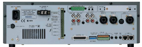
Mặt sau của VM-2120 / VM-2240

VM-2000 cũng là một thiết bị thông báo khẩn cấp theo tiêu chuẩn quốc tế như IEC60849 (EN60849).